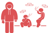
DETENCIONES POR LEY DE DROGAS 2005-2018